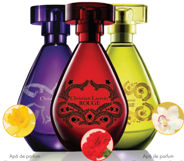
Apă de parfum Christian Lacroix Nuit