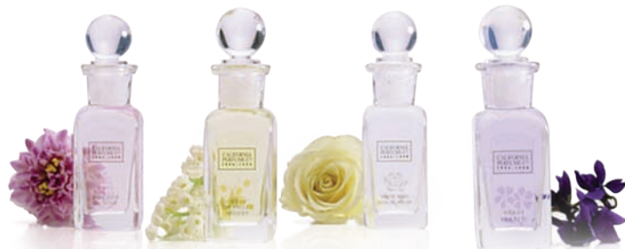
Colecția Little Dot - primul nostru produs (1886)

Istoria celor 15 ani de prezență în România a fost scrisă cu peste 34 de milioane sticlute de parfumuri și povestea merge mai departe, pentru că fiecare zi merită să devină o amintire frumos parfumată!