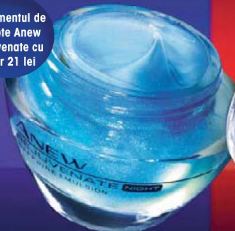
Tratament de noapte Anew Rejuvenate

Tratamentul de noapte Anew Rejuvenate cu doar 21 lei