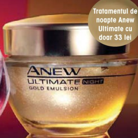
Tratament de noapte Anew Ultimate

Tratamentul de noapte Anew Ultimate cu doar 33 lei