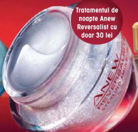
Tratament de noapte Anew Reversalist

Tratamentul de noapte Anew Reversalist cu doar 30 lei